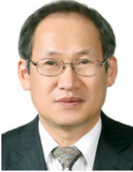
정규상 (성균관대학교 총장)