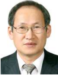
정규상 (성균관대학교 총장)